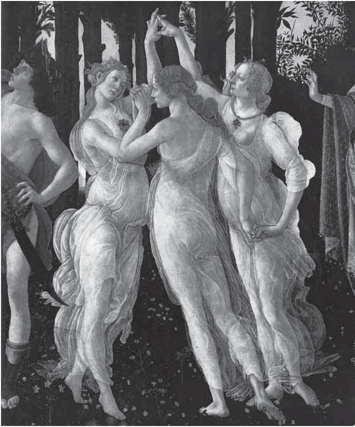
図1 ボッティチェリ作《春》(部分)、1478-83年頃、フィレンツェ、ウフィツィ美術館