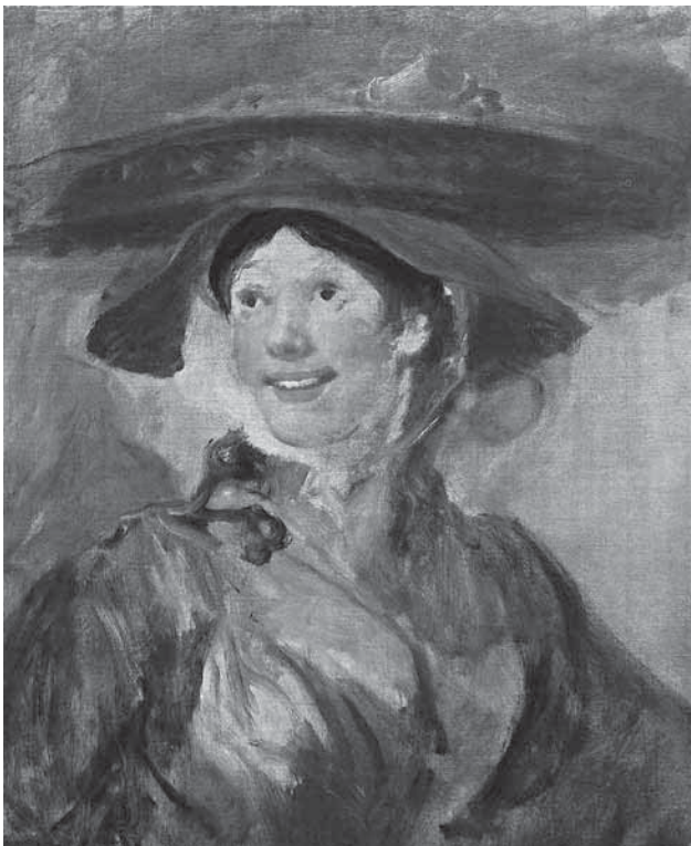
図6 ウィリアム・ホガース作《えび売り娘》 1740年頃、ロンドン、ナショナル・ギャラリー