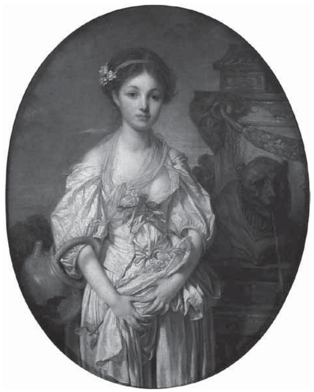
図7 ジャン＝バティスト・グルーズ《壊れた甕》 1773-77年、パリ、ルーヴル美術館