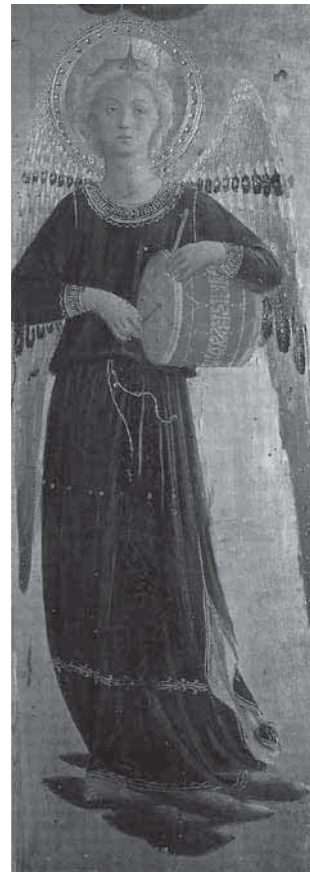
図3 フラ・アンジェリコ作《リナイウオーリ祭壇画》(部分)、 1434-35年、フィレンツェ、サン・マルコ修道院美術館