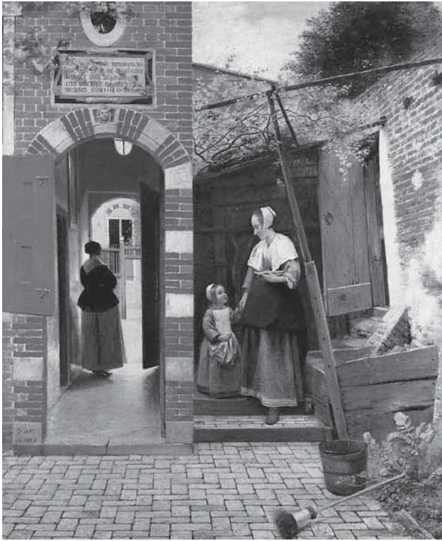
図4 ピーテル・デ・ホーホ作《デルフトの中庭》 1658年、ロンドン、ナショナル・ギャラリー