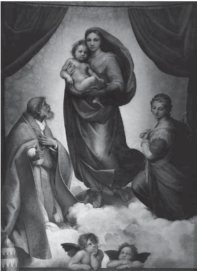
図2 ラファエロ作《サン・シストの聖母》 1513-14年頃、ドレスデン、国立絵画館