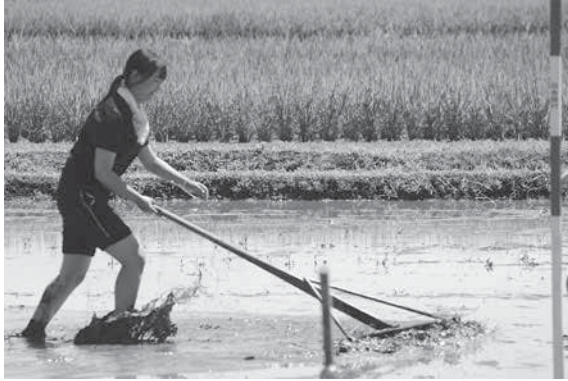
写真1：どろリンピックの様子（小松）

このような形で、学生は「田舎館を知る期間」「とことん活動期間」の間、とりとめのない活動を続けた。しかし、「企画実践期間」になると、「田舎館を知る期間」「とことん活動期間」における一見とりとめもない活動の中に、共育型地域インターンシップin田舎館村の教育プログラムとしての最大の特徴である、学生による仮説生成が秘められていたことが、徐々に明らかになった。