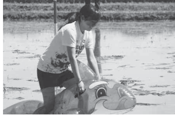
写真2：どろリンピックの様子（八島）