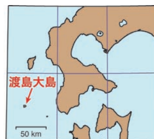
「寛保津波と渡島大島噴火の図」