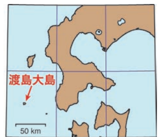
「寛保津波と渡島大島噴火の図」